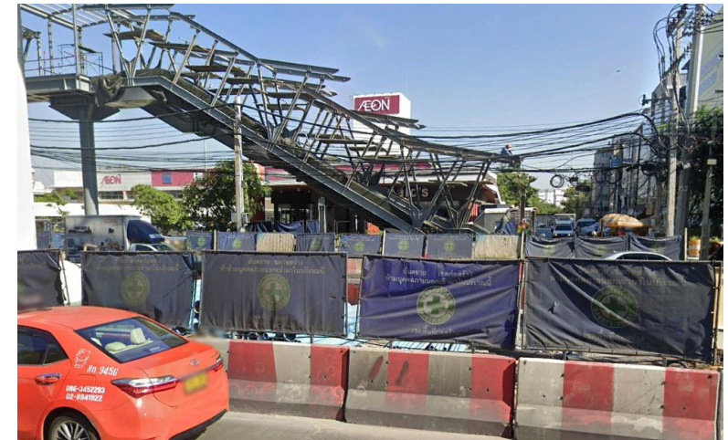
ตัวอย่างการกำหนดเขตพื้นที่ก่อสร้าง