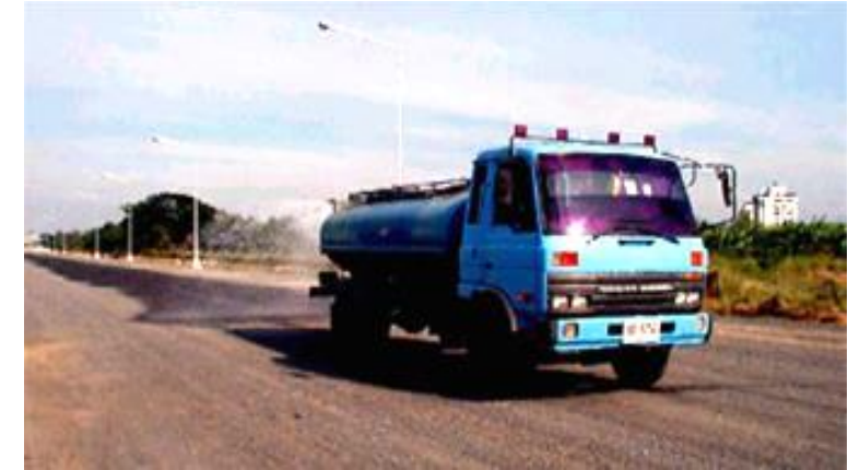
ตัวอย่างการฉีดพรมน้ำ