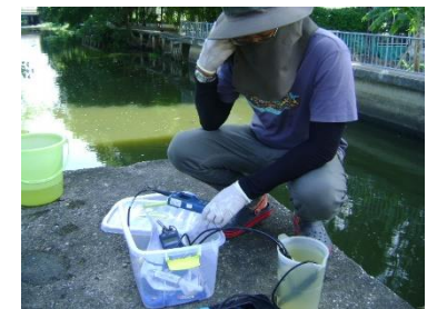
การเก็บตัวอย่างคุณภาพน้ำผิวดิน